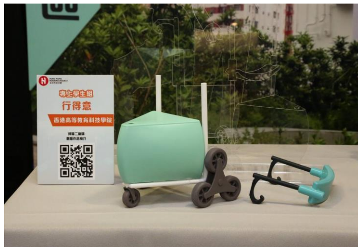
專上學生組銅獎 - 行得意