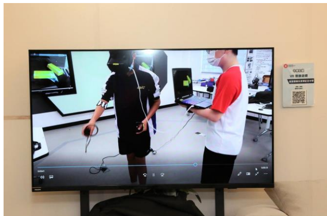
中學生組銅獎 - VR 復康遊戲