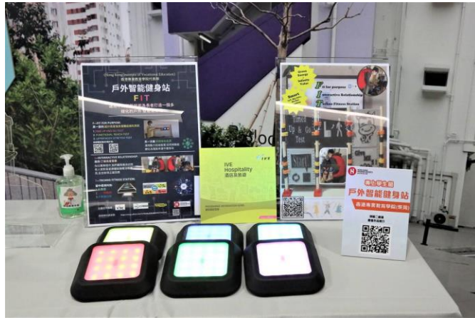
專上學生組金獎 - 戶外智能健身站