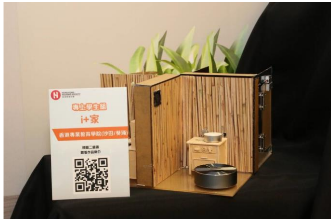
專上學生組銀獎 - i+家