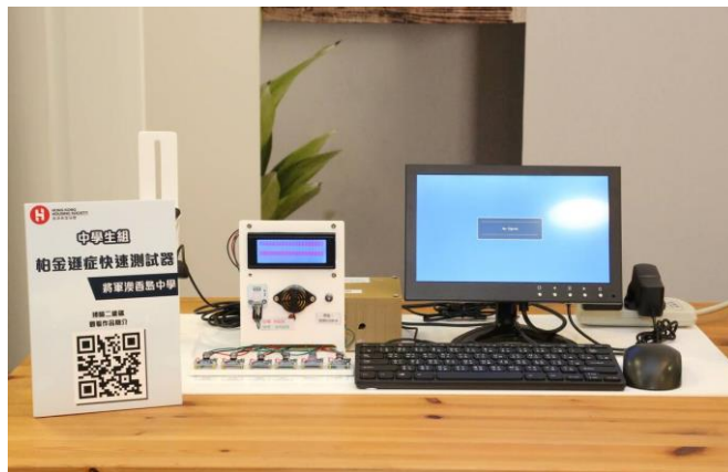
中學生組銀獎 - 帕金森症快速測試器